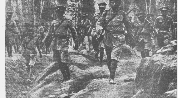
НА ИТАЛО - АБССИНСКОМ ФРОНТЕ. За последние время часть абиссинской армии получила новые европейские оружие и оборудование. На снимке — продвижение вперед вооруженной части (Солдаты).

...Опыт бутербродов? ...С маслом и с пармезаном. Ты мне, утенок, — мама расматривает последние слова и даже замалчивает от удовольствия. ...Мама, ты горькая же женщина, говорит Мама. ...И вот, в разгаре уже все хлопот: оборвант бумагой бувар, тетрадь, перо. ...Досадная мама. ...Итак, мама, ты заблудилась, вот это, — и мама помет победоносный свисток.